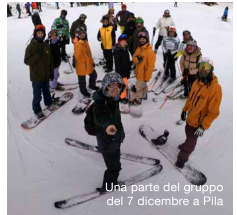
Una parte del gruppo del 7 dicembre a Pila

Per febbraio stiamo aprendo le iscrizioni per la scuola Sci o Snowboard. Dopo esserci trovati davvero bene lo scorso anno torneremo a calcare le nevi di Domobianca. Piccolo gioiellino sopra Domodossola, veloce da raggiungere e adatto a chi si vuole avvicinare alla neve. Ma non temete, anche per i più esperti c'è di che divertirsi. Febbraio ci porterà anche la notturna, in una località che... come da tradizione manteniamo segreta. Continuano anche i corsi di ginnastica dolce nella palestra dell'oratorio al mercoledì sera aperti a tutti, ma davvero a tutti. A tenerli come sempre i ragazzi di BeWonder PT! C'è anche la possibilità di una lezione di prova.